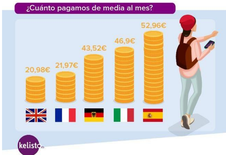
TABLA 1. COSTE MEDIO DE LA FACTURA DE TELEFONIA MOVIL EN EUROPA

“Curiosamente España es el país con las tarifas de telefonía móvil más caras a nivel europeo a pesar de que en el último año los precios han experimentado una reducción drástica. De hecho, el importe medio de los contratos de telefonía móvil analizados ha bajado un 20,68% 1 , cifra que convierte al mercado español en el segundo que más ha reducido el precio de la factura de telefonía móvil en 2016, sólo superado por Reino Unido, donde el importe medio ha caído un 33,52% en el último año. Sin embargo, a pesar de eso, los consumidores españoles pagan más por su línea de teléfono móvil que en el resto de países”, señala Moreno.