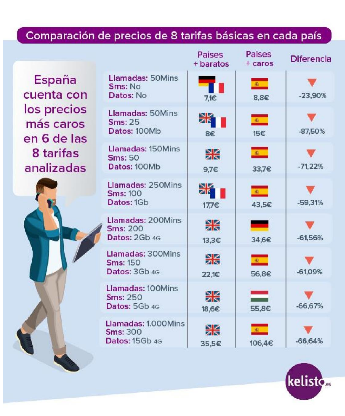
TABLA 3. COMPARACIÓN DE PRECIOS DE 8 TARIFAS BÁSICAS EN CADA PAÍS