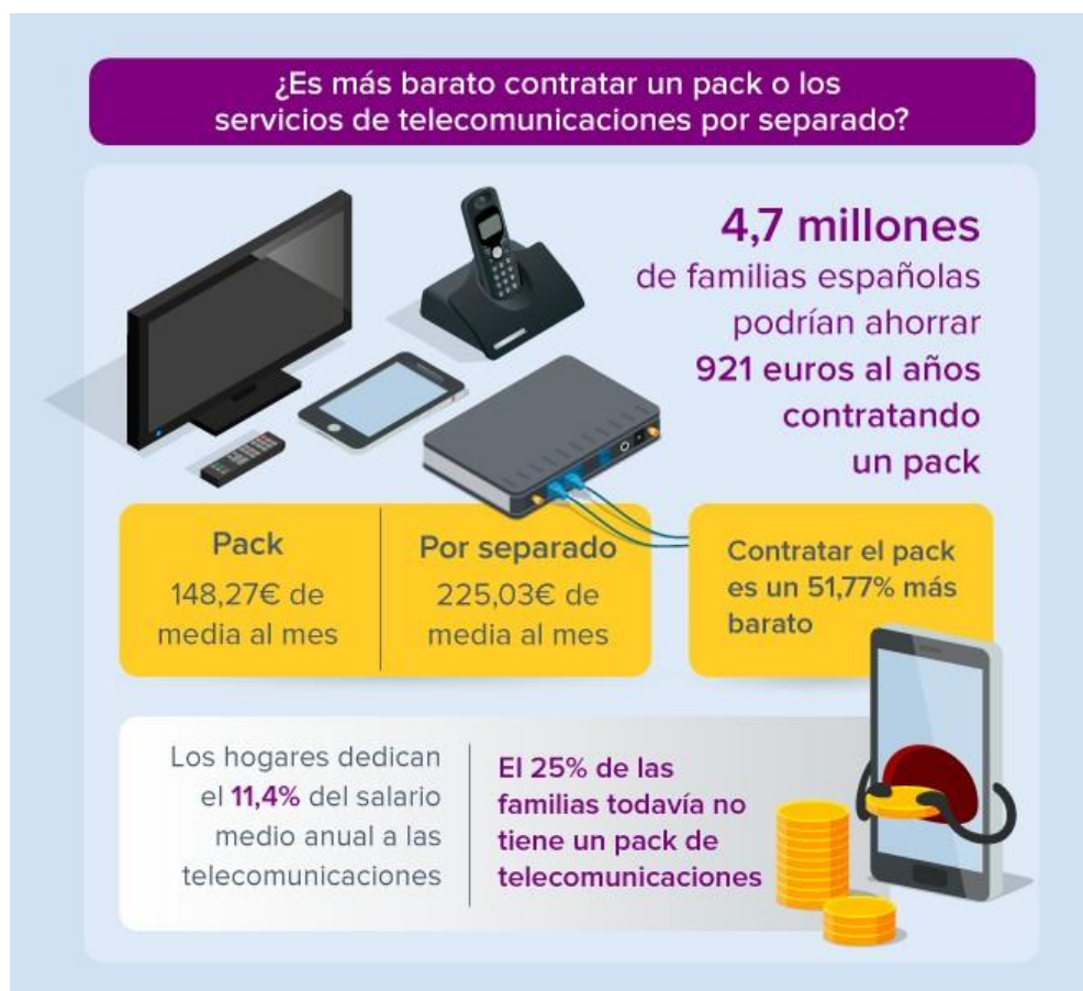
TABLA 1. ¿ES MÁS BARATO CONTRATAR UN PACK O LOS SERVICIOS DE TELECOMUNICACIONES POR SEPARADO?

Teniendo en cuenta lo que pagan de media tanto a las familias que disponen de pack como las que no cuentan con una oferta convergente, en cada hogar español se abona, de media, 186,65 euros al mes por todos los servicios de Internet y telefonía, lo que supone el 11.40% del salario medio anual 6 registrado en 2017 (1.636 euros).